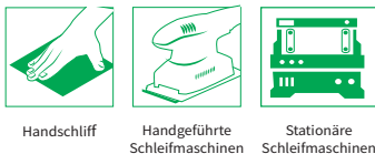
Handschliff Handgeführte Schleifmaschinen Stationäre Schleifmaschinen