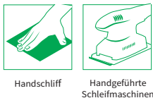
Handschliff Handgeführte Schleifmaschinen